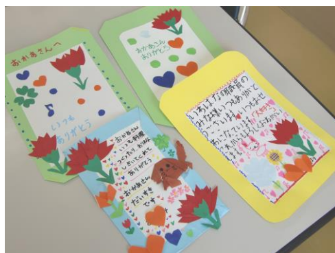
母の日に向けてメッセージカード作り