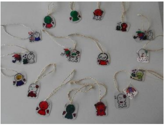
プラバンアクセサリ

クラブ活動や仕事の合間に、創作活動を行っています。個性あふれる素敵な作品をご紹介します。