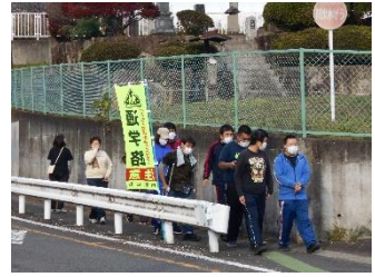
スリーデーマーチ